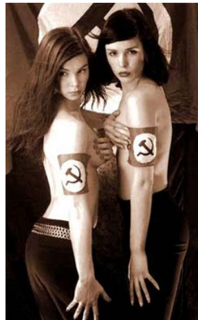
Avantgardistisches Image der NBP

kalen Politikers an. Erklärungen, wonach es den Fürsprechern nicht um die Person Limonovs selber, sondern um das heilige Prinzip der Rechtstaatlichkeit zu tun sei, konnten nicht über den Subtext dieser Schutzaktion hinwegtäuschen. Dieser lautete erstens: Im Konflikt mit der Staatsmacht seien jegliche ideologische Differenzen zu vergessen, selbst dann, wenn es sich um einen bekennenden Nationalsozialisten handelt. Und zweitens: Die „politische Korrektheit“ sei gegenüber einem Kunstschaffenden und Intellektuellen weniger eng zu sehen, auch dann, wenn die Kunst zum Medium politischer Provokation avanciert.