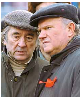
Schriftsteller Aleksandr Prochanov (l.) mit KPRF-Chef Gennadij Zjuganov

Tageszeitung Zavtra (Morgen). Interviewt wurde Chodorkovskij von dem Zavtra -Herausgeber und Romanschreiber Aleksandr Prochanov. Der seit den 1970er landesweit als Autor sozialistischer Kriegsprosa bekannte, zur Zeit aber als der „russische Kipling“ gefeierte Prochanov gilt als einer der Wortführer und Symbolfiguren der nationalpatriotischen Kräfte in Russland, der seine ideologische Festigkeit im August 1991 durch die Unterstützung der Putschisten unter Beweis stellte. Seine seit 1993 erscheinende Zavtra (die identisch konzipierte Vorgängerzeitung Den' (Der Tag) ist aufgrund der Unterstützung des aufgelösten Obersten Sowjets im September 1993 von der Jelzinadministration verboten worden) ist als ein Sammelsurium aus russischorthodoxem, ultranationalistischem und antisemitischem Gedankengut berüchtigt. Zugleich unterscheidet sie sich von ähnlich gelagerten Publikationen als eine Plattform für nationalistisch-intellektuelle Diskurse des äußersten rechten Randes im politischen Spektrum des Landes. Der darin angebotene Ultranationalismus „mit Niveau“ verfolgt schon lange das politische Ziel, radikale Positionen hoffähig zu machen. Auch der neuerliche Versuch, Chodorkovskij zu einem russischen Nelson Mandela oder Martin Luther King aufzubauen, gehört zweifelsohne zum langfristigen Programm Prochanovs, die entscheidenden Personalressourcen des Landes für die Sache des „nationalen Befreiungskrieges“ zu gewinnen.