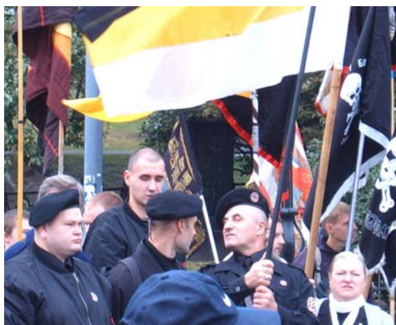
Demonstration von Rechtsextremisten in Moskau, September 2005

„Die ‚Patrioten‘ haben ihr Ghetto verlassen, ihre Bücher werden nicht mehr als marginale Lektüre wahrgenommen“, kritisiert die Tageszeitung Nezavisimaja Gazeta diese Entwicklung. 3 Namen, die noch in den 90er Jahren allgemein geächtet wurden, hätten heute ihren anrühigen Beigeschmack verloren. Der Handel mit „patriotischer“ Ware an „speziell dafür bestimmten Orten“ gehöre der Vergangenheit an. Der pure Chauvinismus werde jetzt überall, selbst in den Supermärkten angeboten.