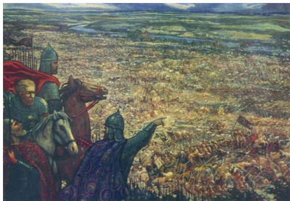
Ilja Glasunov „Zasadnyj Polk“ aus dem Gemäldezyklus „Auf dem Kulikovo-Feld“, 1979

eine zweite Siegesfeier im großen Stil begangen, und zwar das 625. Jubiläum der Schlacht am Kulikovo-Feld. Zur Erinnerung: Am 8. September 1380 wurde das Heer der Goldenen Horde Khan Mamais von den vereinten Streitkräften russischer Fürstentümer unweit der mittell-russischen Stadt Tula vernichtend geschlagen. Angeführt wurden die bis dato untereinander zerstrittenen Russen vom Moskauer Großfürsten Dmitrij Donskoj. In der offiziellen Geschichtsschreibung sowjetischer Prägung wird diese Schlacht als der entscheidende Wendepunkt im nationalen Befreiungskampf gegen das „mongolisch-tatarische Joch“ gefeiert. Für die rechtsorthodox inspirierten Nationalpatrioten gilt sie aber darüber hinaus als der wichtigste Sieg über die „Ungläubigen“. Der gemeinsame Nenner ist der Gedanke, dass Moskau aus dem Kampf mit Mamai als Symbol der Einigung Russlands hervorgegangen sei.