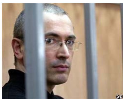
Der Ex-Chef des russischen Ölkonzerns JUKOS Michail Chodorkovskij

Den Ölmagnaten Michail Chodorkovskij ins Gefängnis gesteckt zu haben, gilt international als großer Fehler des russischen Präsidenten Vladimir Putin. Ein vielleicht noch größerer Fehler aber war, Chodorkovskij in eine Zelle mit dem Oberst a.D. Vladimir Kvačkov einzusperren, jenem pensionierten Afghanistankriegsveteranen und passionierten Oligarchenhasser, der des Attentats gegen den russischen Ex-Vizepremier und Chefprivatisierer der 1990er Jahre, Anatolij Čubajs, beschuldigt wird. Denn dieser unfreiwillige gemeinsame Aufenthalt des Oligarchen und des Ex-Geheimdienstlers in der Haftanstalt „Matrosenruhe“ führte zu einer ideologischen Allianz, die in den Medien als ein Modellfall für die künftige politische Landschaft Russlands inszeniert wird. Die Moskauer Tageszeitung Novaja Gazeta („Unabhängige Zeitung“) vom 26. September 2005 ging sogar soweit zu vermuten, dass bald zum ersten Mal seit dem Zusammenbruch der Sowjetunion eine geschlossene Koalition sich der Macht in Kreml in den Weg stellen könne. Die Zeitungsleser werden zu einer öffentlichen Verständigung über die Frage aufgerufen, ob eine Union zwischen den eigentlich antagonistischen politischen Kräften marktliberaler, nationalkommunistischer und rechtskonservativer Orientierung durch ihren gemeinsamen Kampf gegen die russische Machtelite gerechtfertigt wäre.