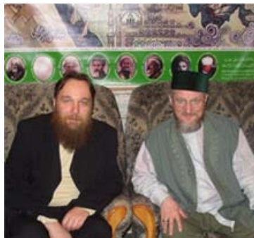
Führer der Neo-Eurasisten Aleksandr Dugin mit Talgat Tadschudin (Obermufti des Muslimischen Verbands der RF und Mitglied des Zentralrats der Eurasien-Partei)

Ende der 1990er Jahre um den Schriftsteller und Publizisten Aleksandr Dugin formiert hat. Es handelt sich um eine rechtsextreme Organisation mit faschistoiden Attributen, Symbolen und Parolen auf esoterisch-okkulten ideologischer Grundlage. Diese Grundlage wird aber auch noch durch eigenwillige Adaptionen und Reminiszenzen, die von Karl Popper und dem Strukturalismus bis hin zur Prager linguistischen Schule reichen, als ein exklusiver Elitendiskurs vermarktet. Kein Wunder, dass der Vordenker der Bewegung Dugin als „philosophischer DJ“ gefeiert wird.