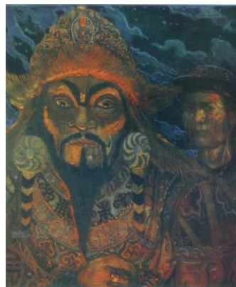
Ilja Glasunov „Khan Mamai“ aus dem Gemäldezyklus „Auf dem Kulikovo-Feld“, 1979

Für die liberalen Kreise war diese zweite Siegesfeier hingegen ein willkommener Anlass, sich über die beiden genannten Lager zu amüsieren. So klärt die Tageszeitung Obščaja Gazeta („Allgemeine Zeitung“, eine Gründung des kürzlich verstorbenen Starjournalisten der Perestrojka Egor Jakovlev) ihre Leser darüber auf, dass es sich bei der Kulikovo-Schlacht in Wirklichkeit um eine banale Geldstreitigkeit gehandelt habe. Die Regionen (Moskau) hätten sich geweigert, Abgaben an die Staatskasse im Zentrum (Goldene Horde) zu bezahlen. Dmitrij habe seinerzeit genauso wie der tschetschenische Präsident Dschochar Dudajev gehandelt, und der Emir Mamai reagierte wie Boris Jelzin. Dabei habe der Aufstand Dmitrijs unter finanziellem Gesichtspunkt gar keinen Sinn gehabt, da die jährlichen Zahlungen an die Goldene Horde viel geringer ausfielen, als die Kosten der unüberlegten Militäraktion. Entsprechend bedeutet auch der auf ein bekanntes Kinderbuch anspielende Titel des Aufsatzes