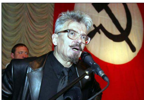
Eduard Limonov, Gründer der National-Bolschewistischen Partei

Die merkwürdige Annäherung unter dem Deckmantel der Kunstfreiheit hat sich auch im Fall eines anderen populären Ad Marginem -Autors, Eduard Limonov vollzogen. Der russische Re-Emigrant, der zwischen 1974 und 1991 in den USA und Frankreich als Novellenschreiber lebte und nach seiner Rückkehr in Russland die National-Bolschewistische Partei gründete, sah sich sogar veranlasst, diesbezüglich Klarheit zu schaffen: Nein, wir sind keine Intellektuellensekte, beteuerte er. Ja, unser Stil ist von Elementen der avantgardistischen Kultur und Ästhetik geprägt. Wir sind aber eine politische Organisation mit konkreten politischen Zielen. 8 Bekanntlich wurde Limonov als mutmaßlicher Gründer einer bewaffneten Terrorgruppe im April 2001 festgenommen und in die Moskauer Untersuchungshaftanstalt „Lefortovo“ gebracht. Mit ihren unbegründeten Putschunterstellungen und überhöhten Strafforderungen bis zu 14 Jahren konnte sich die Staatsanwaltschaft am Ende nicht durchsetzen. Limonov wurde zu vier Jahren Haft wegen Waffenbesitz verurteilt.