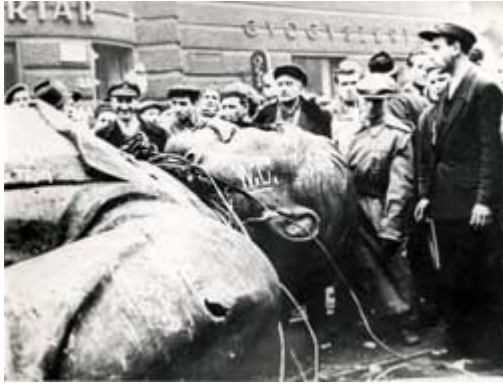
Sturz des Stalindenkmals in Budapest