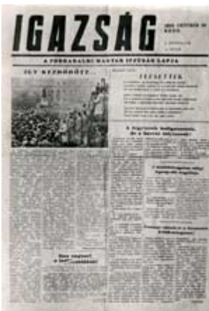
Flugblatt der Aufständischen mit dem Titel "Die Wahrheit"

Anordnung von Imre Nagy über eine allgemeine Waffenruhe , 28.10. 1956