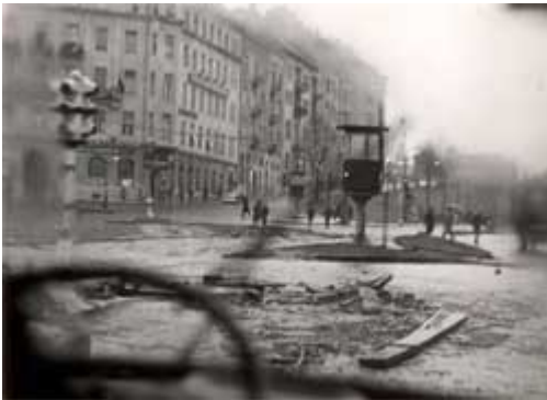
Kampfspuren auf einer Budapester Strasse