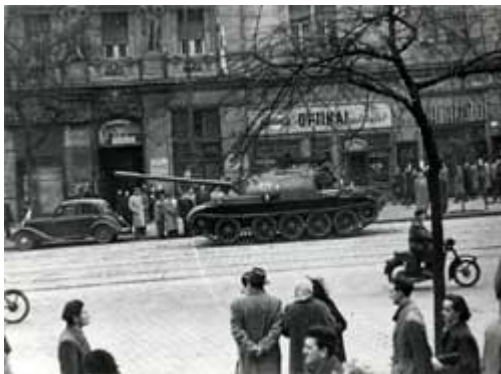
Sowjetischer Panzer in der Budapester Szt. István Ringstrasse

Ein Aufruf des Zentralkomitees vom selben Abend bezeichnet den Volksaufstand als „Konterrevolution“ und die Revolutionäre als „Banditen“. Zur Koordinierung der militärischen Maßnahmen zur Niederschlagung der Unruhen wird ein Ausschuss unter dem stellvertretenden Ministerpräsidenten Antal Apró gebildet.