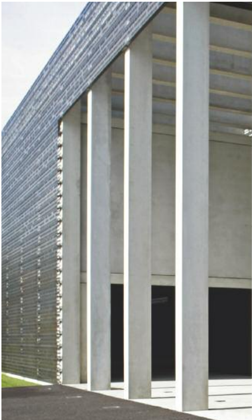
56 DAS EHRENMAL DER BUNDESWEHR