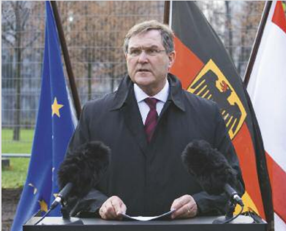
Grundsteinlegung: Ansprache des Bundesministers der Verteidigung, Dr. Franz Josef Jung, anlässlich der Grundsteinlegung des Ehrenmals am 27. November 2008.