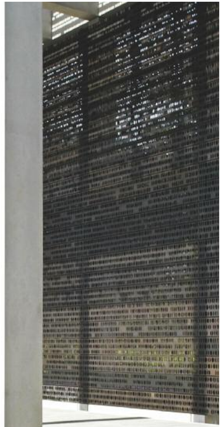
ÖFFENTLICHES ERINNERN UND INDIVIDUELLES TRAUERN 57