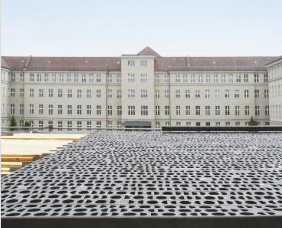
Im Bendlerblock: Die Bronzehülle ist eingetroffen, die entscheidende Bauphase beginnt.

Der Standort des Ehrenmals in Berlin, am Dienstsitz des Bundesministeriums der Verteidigung, ist Ausdruck einer politischen Entscheidung. In Berlin werden die grundlegenden Beschlüsse der Regierung und des Parlaments für die Bundeswehr getroffen. Im Bendlerblock, dem Berliner Dienstsitz des Bundesministeriums der Verteidigung, werden diese Entscheidungen für die Bundeswehr umgesetzt. Der Ort des Ehrenmals verweist damit indirekt durch die räumliche Nähe zur gesetzgebenden und ausführenden Gewalt auf die verfassungsmäßige Bindung und den Vorrang des demokratisch legitimierten politischen Willens für die Bundeswehr.