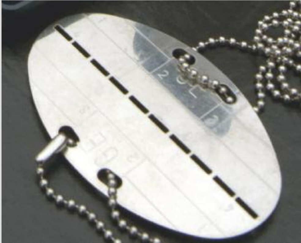
Erkennungsmarke: Mit Eintritt zur Ableistung des Wehrdienstes erhält jede Soldatin/jeder Soldat eine Erkennungsmarke. Sie dient zur schnellen und sicheren Identifizierung.