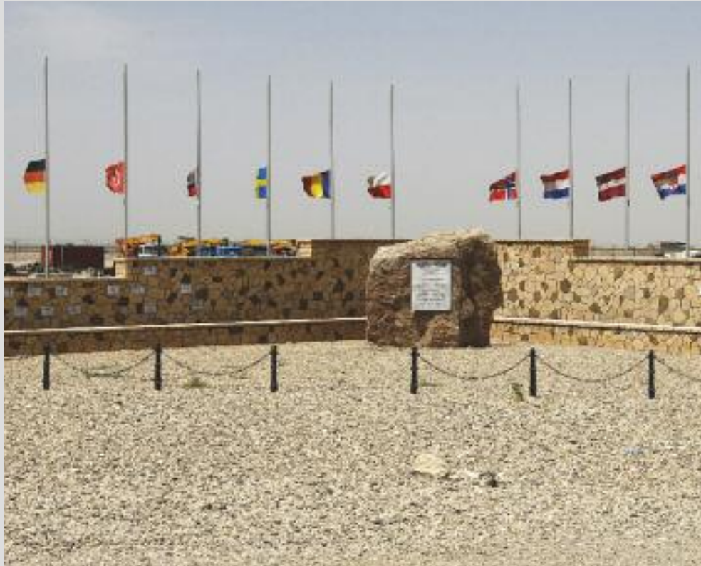
Kabul 2005: Der Gedenkstein für die im Einsatz gefallenen Soldaten.