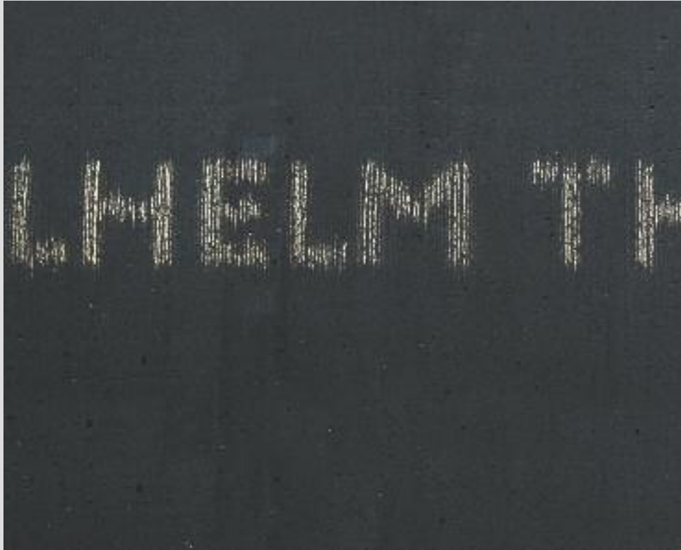
Den Toten zu Ehren: Die Namen der verstorbenen Soldaten leuchten in wechselnder Folge am Ausgang der Cella auf.