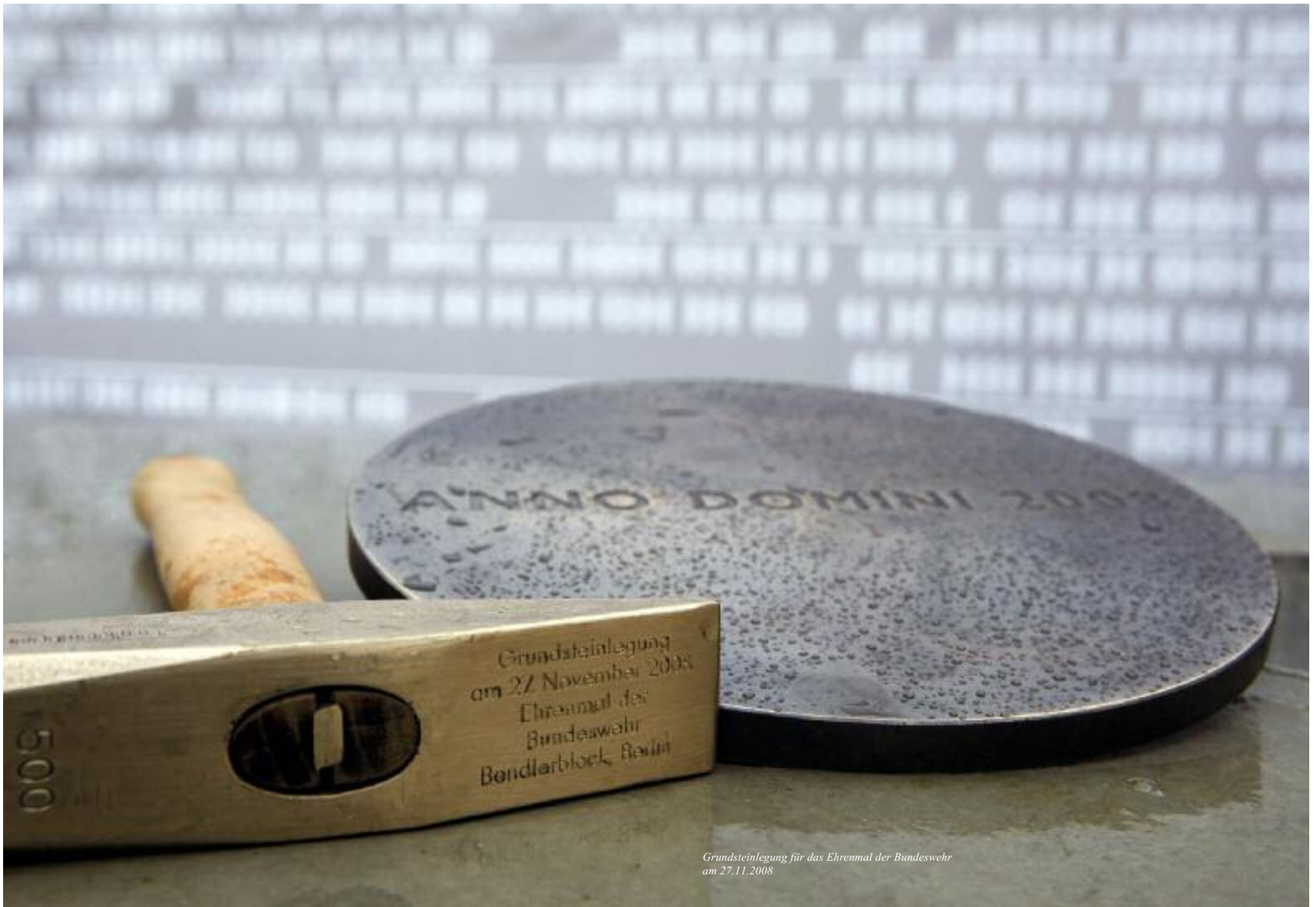
Grundsteinlegung für das Ehrenmal der Bundeswehr am 27.11.2008