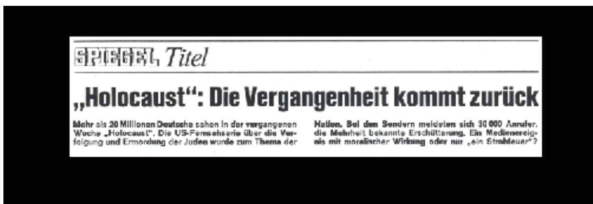
Spiegel-Artikel zur Serie, Ausgabe vom 29.01.1979 (Ausriss)

„Die Mehrheit des deutschen Volkes hat sich im Dritten Reich so verhalten, wie es der Publizist Sebastian Haffner in seinem Buch ‚Anmerkungen zu Hitler‘ beschrieben hat: ‚Aber wer wollte, konnte unwissend bleiben oder sich unwissend stellen.‘ Daneben aber gab es die Dorfs – auf allen Ebenen -, die Liebdiener des Systems, seine Säulen. Über sie sollte mit Vorrang in den Schulen und zu Hause gesprochen werden. ‚Holocaust‘ hat das Klima dafür geschaffen.“