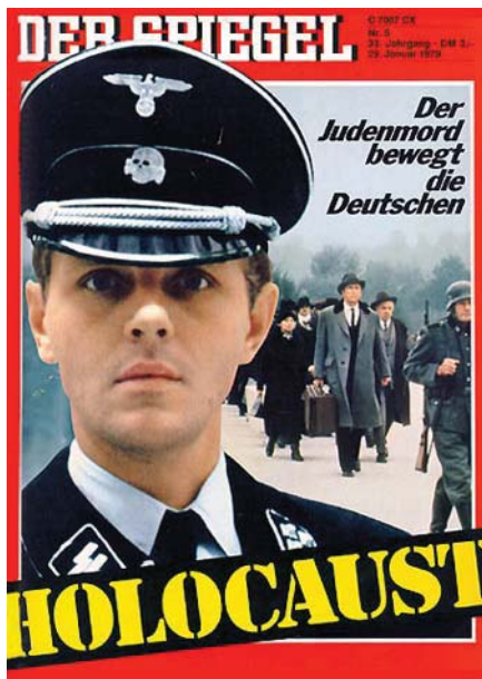
Titelseite des Spiegel vom 29.01.1979