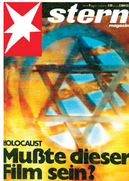
Titelseite des stern vom 01.02.1979

Wie keine Fernsehsendung vor- und nachher hat die amerikanische Serie „Holocaust“ zu Beginn des Jahres 1979 die deutsche Bevölkerung aufgerüttelt und zu Diskussionen angeregt. Zwar hatte eine zögernde öffentliche Aufarbeitung der nationalsozialistischen Judenverfolgung bereits gegen Ende der 60er Jahre eingesetzt. Dennoch war bislang den meisten Deutschen die ganze Tragik dieser NS-Verbrechen durch den anonymen Schleier der „sechs Millionen Opfer“ kaum tiefer ins Bewusstsein gedrungen. In dieser Hinsicht leitete „Holocaust“ einen Wandel ein: Durch das Personalisierungskonzept der Serie, durch die Darstellung des Leidensweges der jüdischen Familie Weiss sahen sich Millionen Zuschauer emotional berührt und persönlich angesprochen. Der damit ausgelöste Bruch setzte nicht nur eine öffentliche und familiäre Auseinandersetzung um Schuld, Mitschuld und Verantwortung in Gang. Gerade die jüngere Generation verlangte zudem nach weiteren Fakten, nach Erklärungen und Deutungen historischer Zusammenhänge; es war „der Augenblick, nach dem ein Volk den Drang zum Sagen hatte“. 1