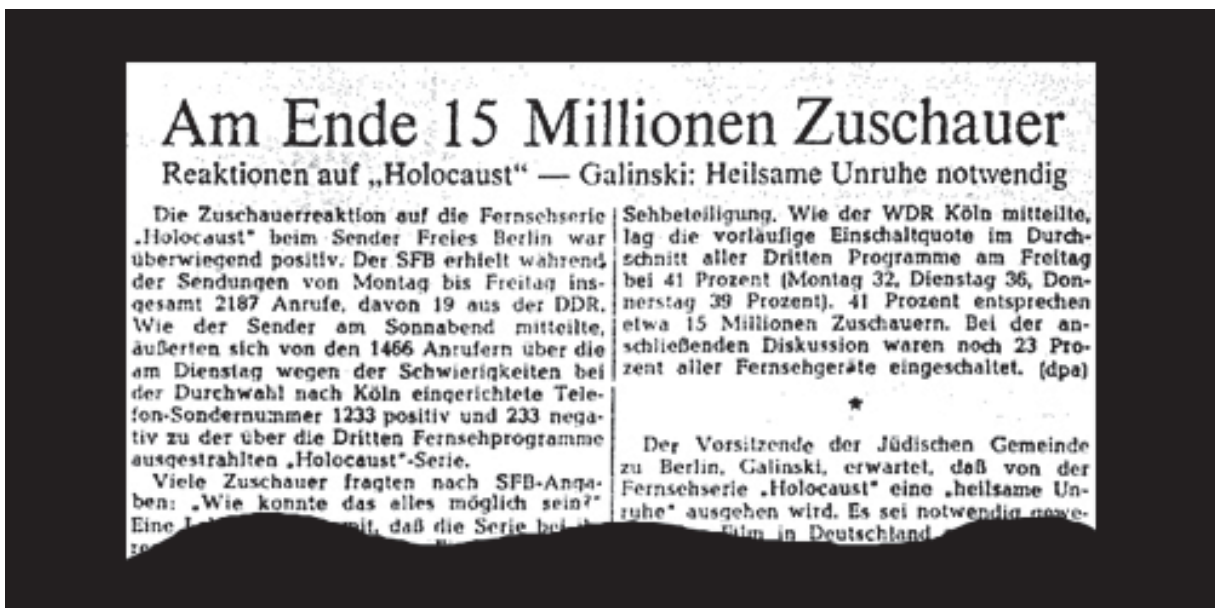
Tagesspiegel vom 28.01.1979 (Ausschnitt)

fehlende Darstellung gesellschaftlicher Ursachen kritisiert, die zur NS-Diktatur führten. 26 Eine seltene Ausnahme bildete ein umfangreicher Artikel in der Fachzeitschrift „Film und Fernsehen“, denn dort wurde detailliert auf die westdeutsche Diskussion zu „Holocaust“ eingegangen. Der Autor räumte in seinem Beitrag zwar ein, er „bezweifle keineswegs, daß Millionen Menschen Erschütterung und Entsetzen aufrichtig empfunden haben“, konzentrierte sich ansonsten aber auf Schmähungen der amerikanischen Serienproduzenten sowie der bundesdeutschen „Fernsehgewaltigen“. Diesen machte er die „peinliche Situation“ rund um Ankauf und Platzierung der Serie, jenen die kommerziellen Absichten hinter dem „Tod in der Gaskammer als umsatzsteigerndes Farbfernsehspiel“ zum Vorwurf. Des Weiteren bescheinigte er den westdeutschen Politikern mangelndes Interesse an einer objektiven Aufarbeitung der NS-Vergangenheit, wohingegen er eben dies in der DDR vorbildlich verwirklicht sah: „Nicht die ‚Deutschen‘ haben Nachhilfeunterricht nötig. Der historische Hilfsschüler heißt Bundesrepublik Deutschland. Sie ist sitzengeblieben. Mitten in ihrer unbewältigten Vergangenheit.“ 27