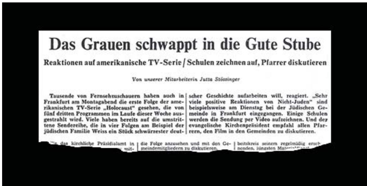
Frankfurter Rundschau vom 24.01.1979 (Ausschnitt)

Die Berichterstattung zu „Holocaust“ war von Beginn an nicht auf formale und inhaltliche Aspekte beschränkt (dramaturgischer Inhalt der einzelnen Folgen; szenische Umsetzung; Detailgenauigkeit; Zuschauerquoten u.ä.), sondern thematisierte vor allem moralisch-ethische Fragen der Darstellbarkeit und Kommerzialisierung von Völkermord, die Auswirkungen auf die gesellschaftlichen Erinnerungskulturen in Deutschland und anderen mitteleuropäischen Ländern sowie die Folgen für das Selbstverständnis der historischen Wissenschaft und der Zukunft der Dokumentarfilmer.