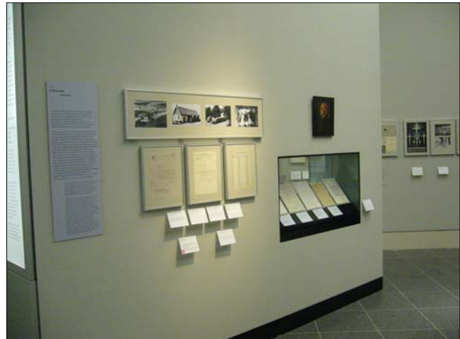
Leicht zu übersehen: Die Ausstellungswand zur "Euthanasie"

Ein wichtiger Grundgedanke für dieses Ausstellungsprinzip ist jener des für sich sprechenden Objekts, und damit setzt die DHM-Dauerausstellung das fort, was 1995 Christoph Stölzl, Gründungsdirektor des Museums, mit der Ausstellung "Bilder und Zeugnisse der deutschen Geschichte" begann und im Katalog-Vorwort als den "Dialog mit dem authentischen Geschichtszeugnis" bezeichnete, der dem Betrachter die "spürbare Nähe der Geschichte" vermittele. Objekte sollen als "historische Zeugnisse" – so der Ausstellungsführer 2006 – wirken, und durch die Bildung von Objektgruppen einer formalästhetischen Isolierung entgehen. Die Exponate sollen die Geschichte nicht illustrieren, sondern "bezeugen als Indizien des Geschichtsprozesses eine gelebte Wirklichkeit", so Hans Ottomeyer und Hans-Jörg Czech im