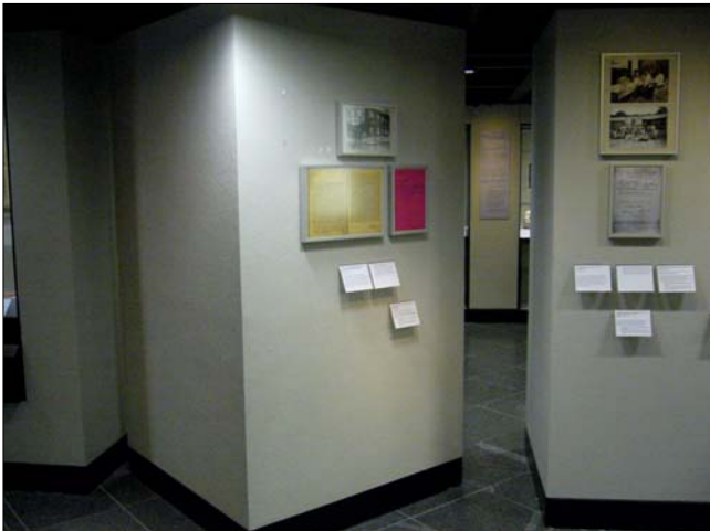
Die Schwulen in der Schmutzdecke: Drei Dokumente zur Verfolgung der Homosexuellen

Nicht nur ärgerlich, sondern fast schon schäbig stellt sich eine Ausstellungswand zur Verfolgung der Homosexuellen dar. Ganz abgesehen davon, dass ihre Verfolgung den Ausstellungsmachern kein gesonderter Sequenztext wert war, tauchen sie allein im Thementext zum KZ-System (7.5.4.) als Wort innerhalb einer Aufzählung der in den Konzentrationslagern Festgehaltenen auf. Die ideologischen Zusammenhänge der Homosexuellenverfolgung werden nicht erläutert. Diese Wand begnügt sich deshalb mit einer altbekannten Fotografie (Polizisten vor dem geschlossenen El Dorado am 5.3.1933), einem