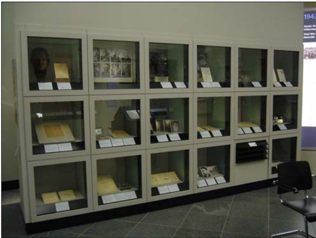
Die Vitrinenwand "Der zersplitterte Widerstand"