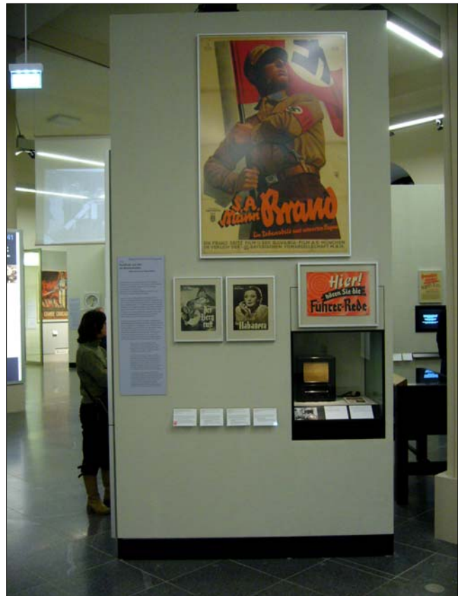
Die Ausstellungswand 7.3.6.: Rundfunk und Film als Massenmedien

Nicht anders stellen sich die übrigen, vertiefenden Ausstellungswände dar, zum Beispiel zur "NS-Architektur und Siedlungsbau" (7.3.8.): ein Thementext, eine Fotografie einer Einfamilienhaussiedlung, eine Broschüre "Die Siedlung als Stätte des Lebens", eine Zeitschriftendoppelseite über die Planung der Berliner Nord-Süd-Achse und schließlich ein Modell (1998) der monumentalen, für Berlin geplanten "Halle des Volkes". Wie radikal die Nazis Architektur und Städtebau bei der Umgestaltung vieler Städte einsetzten, lässt sich anhand dieser ausgewählten Exponate nur bestenfalls entfernt erahnen.