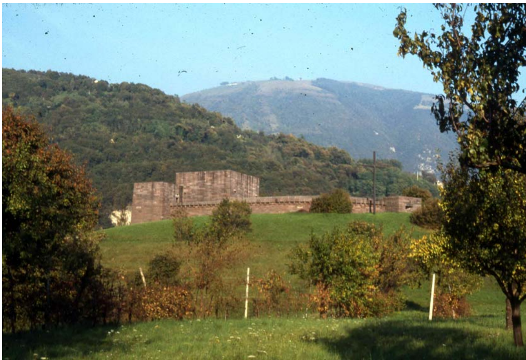
Abb. 2: Totenburg Quero, eingeweiht 1939, mit integriertem Gefechtsbunker rechts