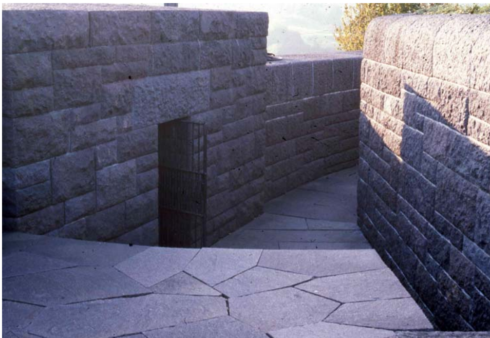
Abb. 4: Blick vom Ausgang zur Rundbastion auf den Eingang des überformten Bunkers

ler Identitätsstiftung in der deutschen Gartenkultur , Worms 2001, S. 119-134; ders., Die „unsterbliche Landschaft“, der Raum des Reiches und die Toten der Nation. Die Totenburgen Bitoli (1936) und Quero (1939) als strategische Memorialarchitektur, in: kritische berichte 29 (2001) H. 2, S. 56-70; ders., Beton und Totenkult. Fortifikationsarchitektur in Kriegerdenkmälern der zwanziger und dreißiger Jahre, in: Silke Wenk (Hg.), Erinnerungsorte aus Beton. Bunker in Städten und Landschaften , Berlin 2001, S. 147-157, S. 244f.