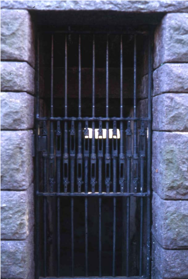
Abb. 5: Tür des überformten Bunkers (Foto: Christian Fuhrmeister, 1997)

Tischler ließ einen Gefechtsbunker des Ersten Weltkrieges (Abb. 3) außen mit „herrischen“ 4 Porphyrquadern überziehen (Abb. 4). Vergleicht man den Grundriss dieser Totenburg mit demjenigen einer Kirche, dann entspricht der Bunker der Apsis des Hauptschiffs (die man nach Durchschreiten eines symbolischen Schützengrabens erreicht). In der Apsis befindet sich das Heiligste, nämlich der Blick aus dem Bunker. Dieser Blick bietet den Besuchern die Möglichkeit, das zu sehen, was die hinter ihnen bestatteten Soldaten sahen, bevor sie starben: das Gefechtsfeld, also den Feind.