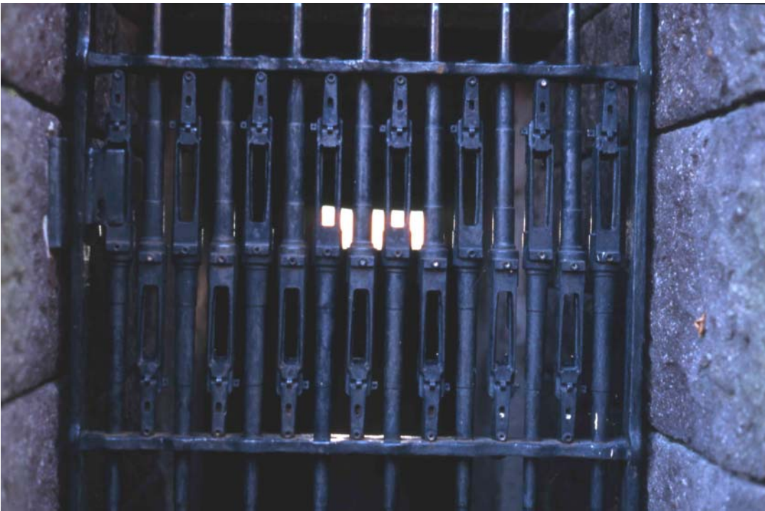
Abb. 6: Karabinerschlösser in der Tür

Der schmale Zugang kann mit einer schmiedeeisernen Tür verschlossen werden (Abb. 5). Eben weil der Bunker innen leer ist und dem Besucher nichts außer dem Blick durch die Schießscharte bietet, handelt es sich um eine ebenso sakrale wie symbolpolitische Inszenierung. Diese Inszenierung ist – wie bei Mecks Entwurf – weitgehend abstrakt, d.h. offen für Bedeutungszuweisungen. Zugleich geben jedoch Form und Material die Richtung der Assoziationsketten vor. Denn an dieser prominenten Stelle bilden alte Karabinerschlösser das Zentrum des Türgitters (Abb. 6). Tischler beauftragte die Kunstschmiede, 15 Schlösser (als ‚Herzstück‘ der Karabiner) in die Tür zu integrieren. Anders als beim italienischen Soldatenfriedhof Redipuglia, wo bis zu einer Neugestaltung im Jahr 1938 unterschiedlichstes Kriegsgerät gezielt Zerstörung und Vernichtung anklagen sollte – verrostete, verbogene und zerstörte Geschütze, verbeulte Helme, Schrapnell- und Granatensplitter, mit Stacheldraht verbunden –, betont der Einsatz von authentischem Material bei der deutschen Totenburg vornehmlich Ordnung und Regelmäßigkeit. Die serielle Reihung der Karabinerschlösser suggeriert und symbolisiert insofern eine Regelmäßigkeit, ja Gesetzmäßigkeit des Soldatentodes.