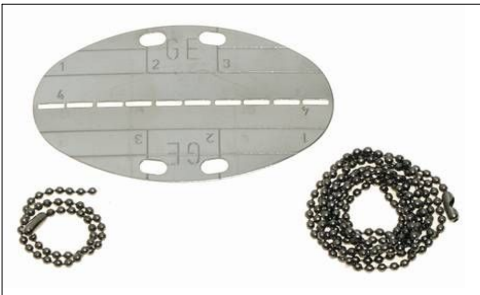
Abb. 7: Erkennungsmarke der Bundeswehr

Rein formal gibt es bei militärischen Erkennungsmarken durchaus Variationen, Eigenheiten und Spezifika, doch die Gemeinsamkeiten überwiegen, über Zeiten und Landesgrenzen hinweg. 5 Bei der Bundeswehr ist die Marke standardmäßig mit einer langen und einer kurzen Kette versehen (Abb. 7): Die lange ist für den Hals bestimmt, die kurze für den großen Zeh der möglicherweise entstellten Soldatenleiche.