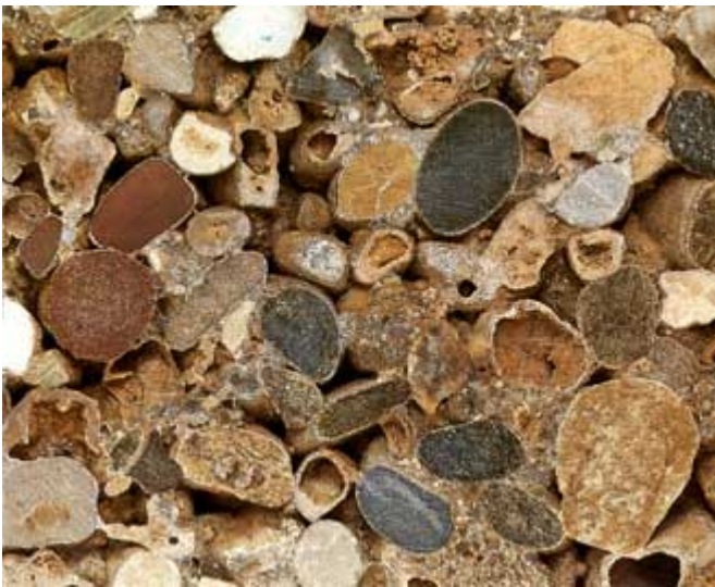
Abb. 2: Nagelfluh geschliffen (aus: Walter Schumann, Der neue BLV Steine- und Mineralienführer , 3. Aufl. München 1991, S. 271)

bleibt. 16 Nicht so ausdrücklich erklärt ist eine Form-Analogie zwischen teils zerbrochenen Erkennungsmarken und dem Oberflächenmuster eines Monoliths aus Nagelfluh, der in der „Cella“ „aus dem Boden wachsen“ soll (obgleich nicht der märkische Sand, sondern das Voralpengebiet für seine Herkunft genannt worden ist). Die Gerölle in diesem Konglomerat bilden an halbierenden Schnittflächen ein Muster aus elliptischen Flecken, ähnlich dem Umriss der Erkennungsmarken. Kein anderes Gestein hätte eine solche Formanalogie ermöglicht. 17 Nagelfluh gehörte zum Material der zerstörten Buddha-Statuen von Bamian in Afghanistan, dem Aktionsgebiet deutscher Gebirgsjäger aus Mittenwald. 18 Eine Anspielung auf Auslandseinsätze war möglicherweise auch gemeint, wenn mit dem drittplatzierten Entwurf eine Zeile aus Rilkes Gedicht „Der Fahnenträger“ als Inschrift vorgeschlagen wurde, da dieses ein Derivat der „Weise von Liebe und Tod des Cornets Christoph Rilke“ sei.